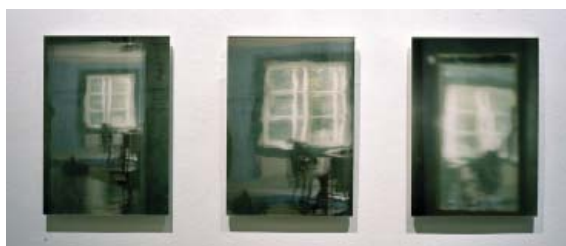
Pièces de Harmaa sarja (Série grise) (collection du Musée des Beaux-Arts de la ville de Helsinki)

Elle est lauréate du prix Ars Fennica 2001 .