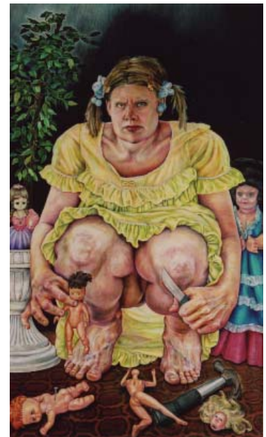
Stiina Saaristo - Tyttöjen välisestä ystävyystestä ( De l'amitié entre filles ), crayon de couleur sur papier, 250 cm x 146 cm.

Stiina Saaristo est née en 1976. Elle vit et travaille à Helsinki, Finlande.