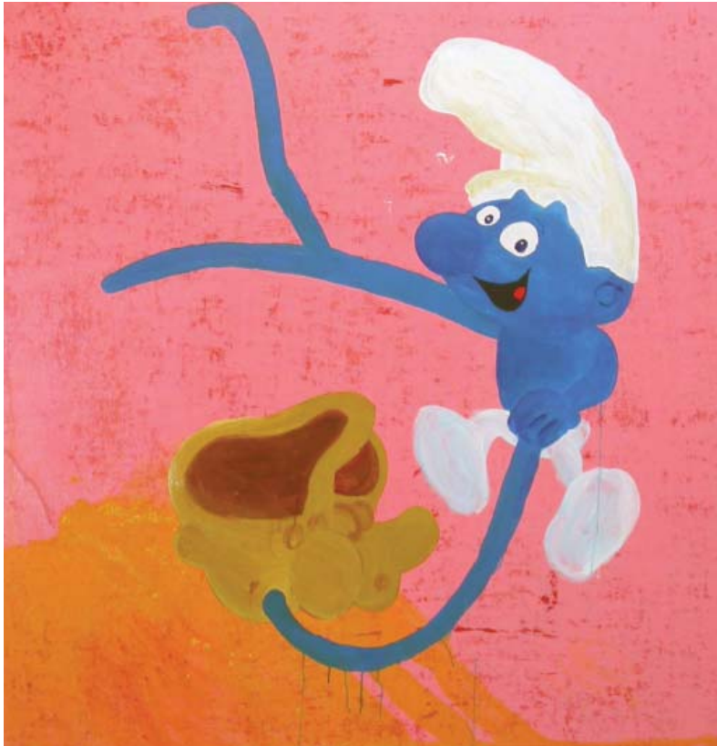
Riiko Sakkinen - Smurfen schtroups