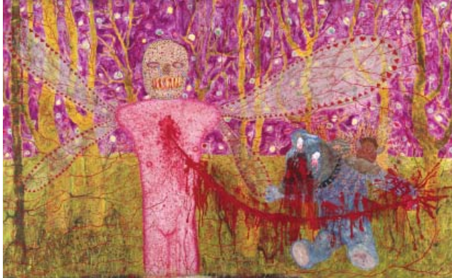
Elina Merenmies - Ice-Cream eyes (When nobody's Watching)