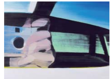
Jussi Niva - série « Blind spots »

La Peinture de Jussi Niva s'élabore en étroite relation avec la perception que l'on en a. Les variations de lumière et les effets de reflets renvoient à ce qui est exposé au sens photographique ; la présence physique voire tridimensionnelle des peintures en osmose avec l'espace, renvoie à ce qui est exposé au sens d'un énoncé de spatialisation. Ces peintures en étroite relation avec l'architecture, révèlent le visible et nous invitent finalement à saisir ce que peut signifier la notion d'Exposition dans tous les sens du terme.