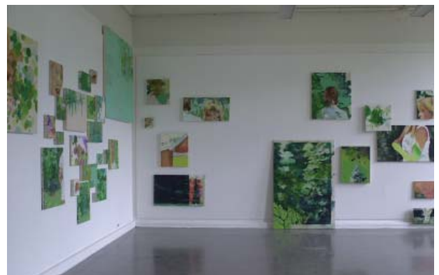
Maiju Salmenkivi - Installation de peintures « Tapiola »