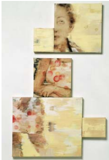
Maiju Salmenkivi- Installation de peintures Round and Round