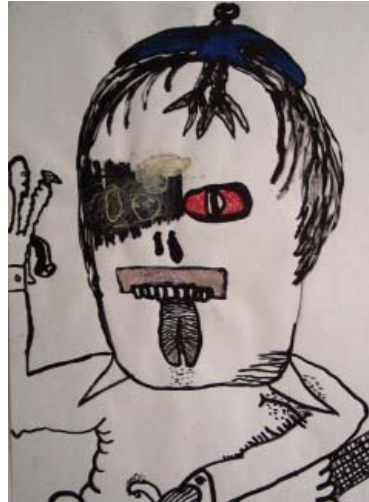
Janne Räisänen - Kiltin oppilaan fantasia ( Le fantôme de l'élève sage )